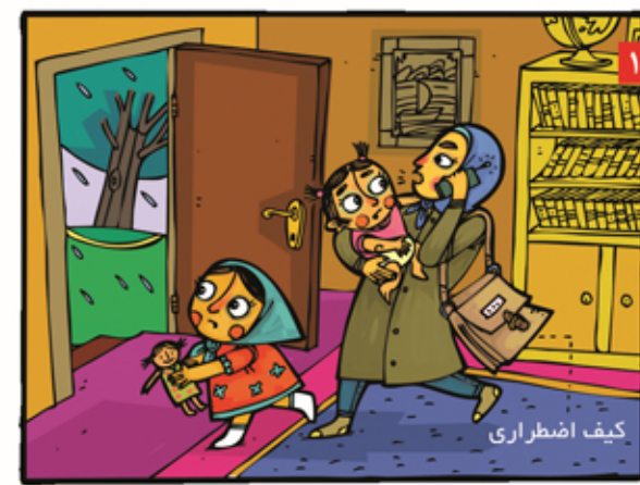
هنگام تخلیه، کیف اضطراری را بر میداریم و خروجمان را به همسایگان و آشنایان اطلاع می دهیم.