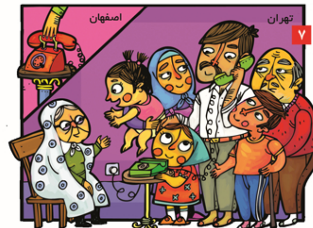
همه اعضا، خانواده آدرس و تلفن یکی از آشنایان در شهر دیگر را می دانند.